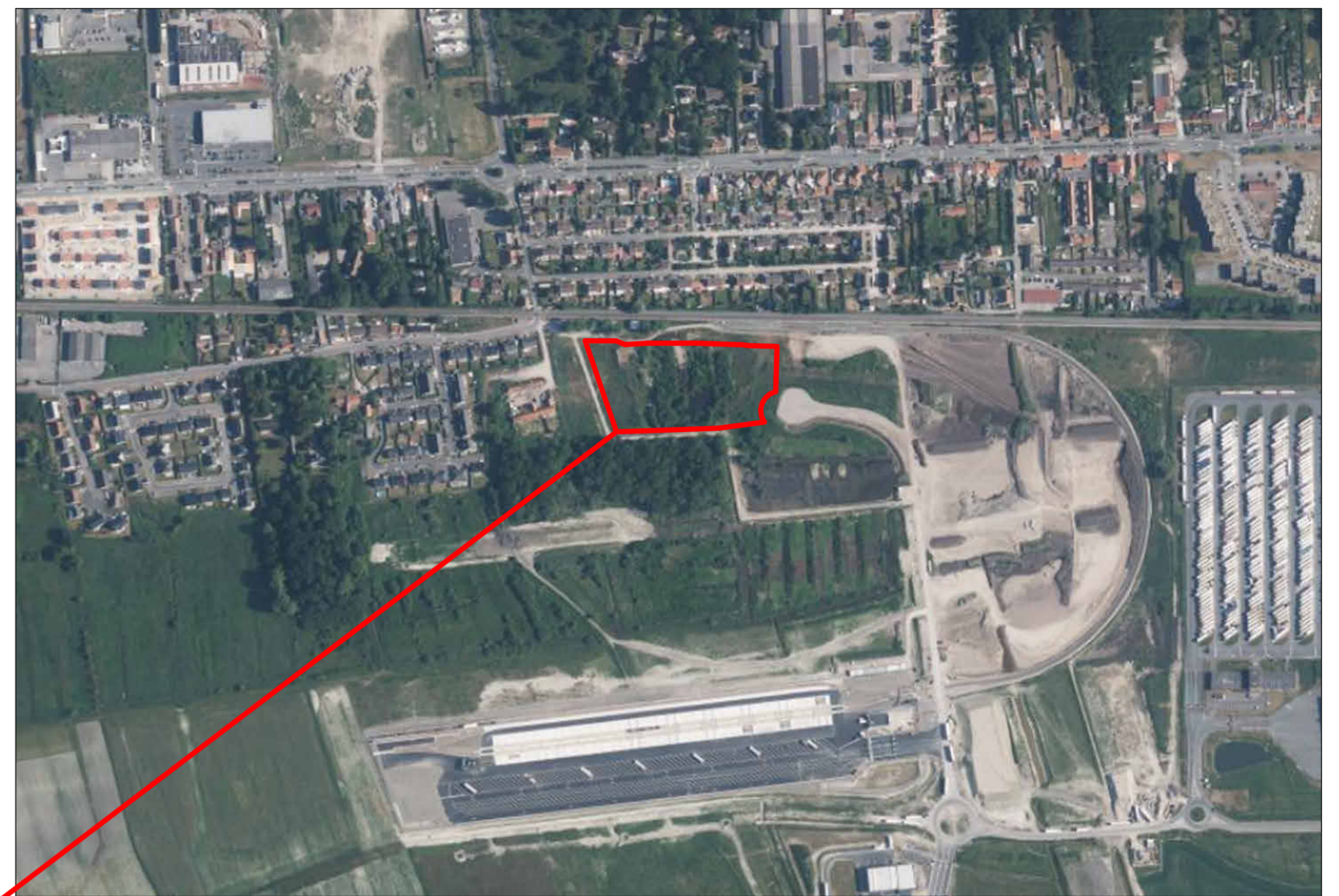
VUE AERIEENNE - Ech. : 1 / 5 000e

TERRAIN D'IMPLANTATION : Commune de MARCK Section CI - Parcelles n° 3, 4p, 12p, 254p, 256p, 258p Surface du terrain : 19 635 m 2